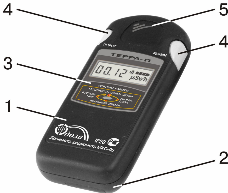
Рисунок 1.1 - Общий вид дозиметра

Дозиметр выполнен в плоском прямоугольном пластмассовом корпусе с закругленными углами.